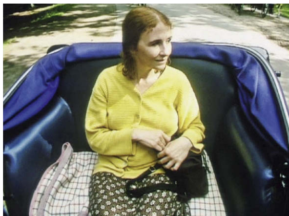
Abb. 4.1: Karen im Tivoli, zugleich ist »Le Cygne« auf einer Melodica zu hören ( Idioterne , 0:00:23).